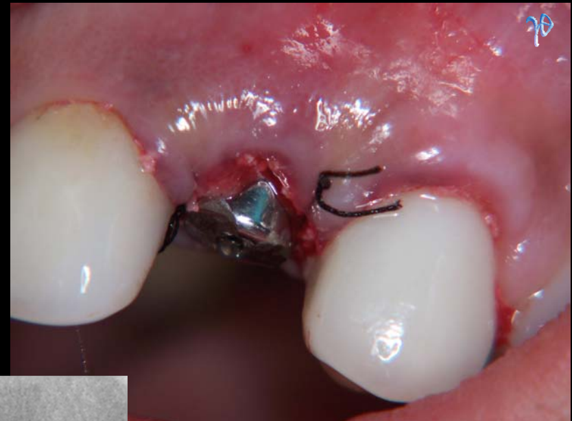
και άμεση τοποθέτηση οδοντικού εμφυτεύματος