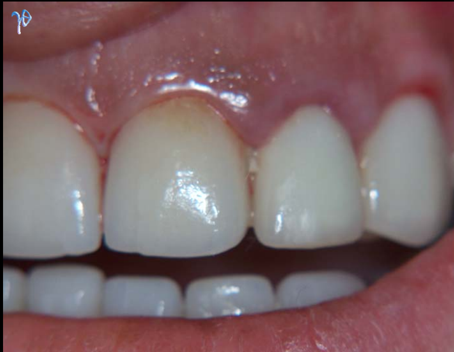
προς εξαγωγή #22