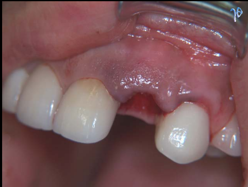
ατραυματική εξαγωγή #22