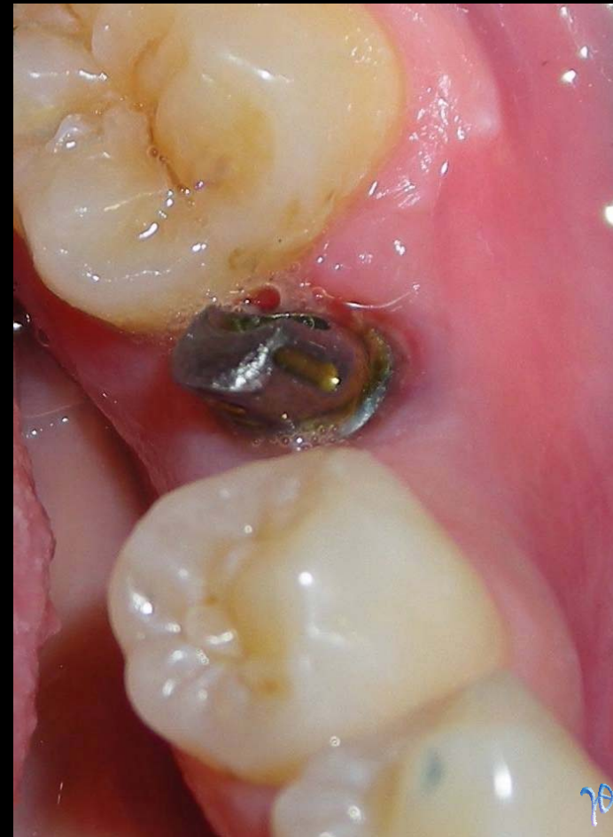
η τοποθέτηση abutment