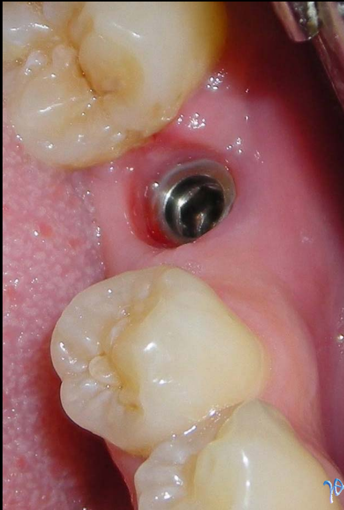
μετά την αποκάλυψη και λήψη αποτυπώματος